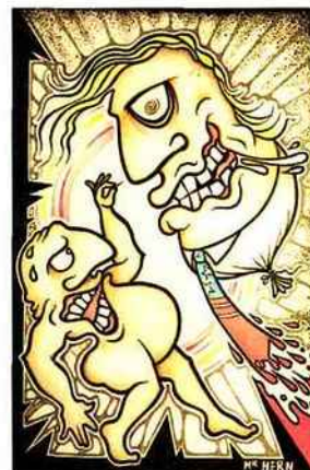
Mr Hern, No Comment , 2017, encre de couleur sur papier kraft, 29 x 21 cm.

Du 19 mai au 13 juillet, du mardi au samedi, de 13h à 19h