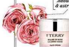
Adoucissante & astringente

Ce totem luxueux et décomplexé se porte au quotidien.