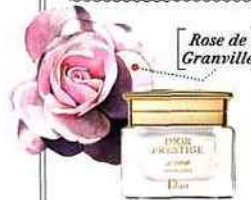
Rose de Granville

Incarnant toutes les facettes de la féminité, la fleur est l'indétrônable idole de la mode, de la joaillerie et de la beauté.