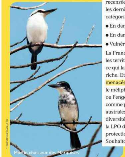
Martin chasseur des Marquises

La France abrite en métropole, et surtout dans les territoires ultramarins, près de 1500 espèces, ce qui la classe parmi les pays à l'avifaune la plus riche. Et depuis 5 ans, 11 nouvelles espèces sont menacées, rejoignant ainsi la liste rouge, comme le méliphage toulou, le monarque de Fatuhiva ou l'engoulevant moustac, ce dernier étant jugé comme probablement éteint dans les terres australes. À l'issue de la convention pour la diversité qui s'est tenue à Cancun (Mexique), la LPO demande que des programmes de protection des habitats naturels soient engagés. Souhaitons qu'elle soit enfin entendue.