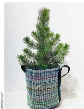
JARDIN EN ART

De 25 à 110 €. En vente chez Jardins en art, 19, rue Racine, 75006 Paris, tél. 0156810123, http://jardinsenart.fr et chez Bacsac, www.bacsac.com