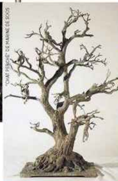
"C'EST PÉRIQUE DE MARINE DE SOOS"

"Jardin en fête" propose une exposition photos rapprochant les deux univers de l'art et du jardin, dans un cadre bucolique au cœur du quartier de l'Odéon.