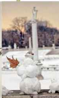
JARDIN DU LUXEMBOURG, BONNORRE DE NEGRES-LAINE DE VIRIEU