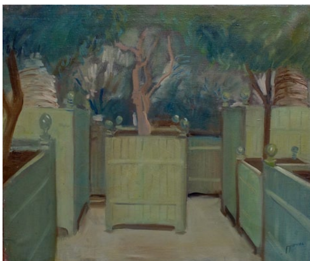
Des caisses