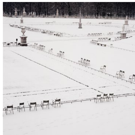
Triptyque_3_Jardin du Luxembourg, 08h05, 23 février 2005