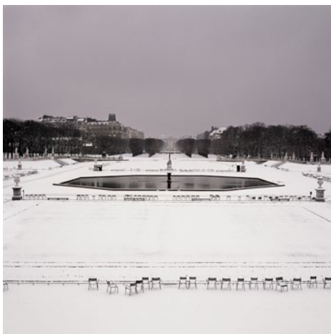
Triptyque_2_Jardin du Luxembourg, 08h10, 23 février 2005