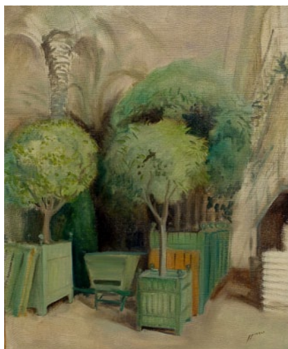
Or © Pascale P. Maes