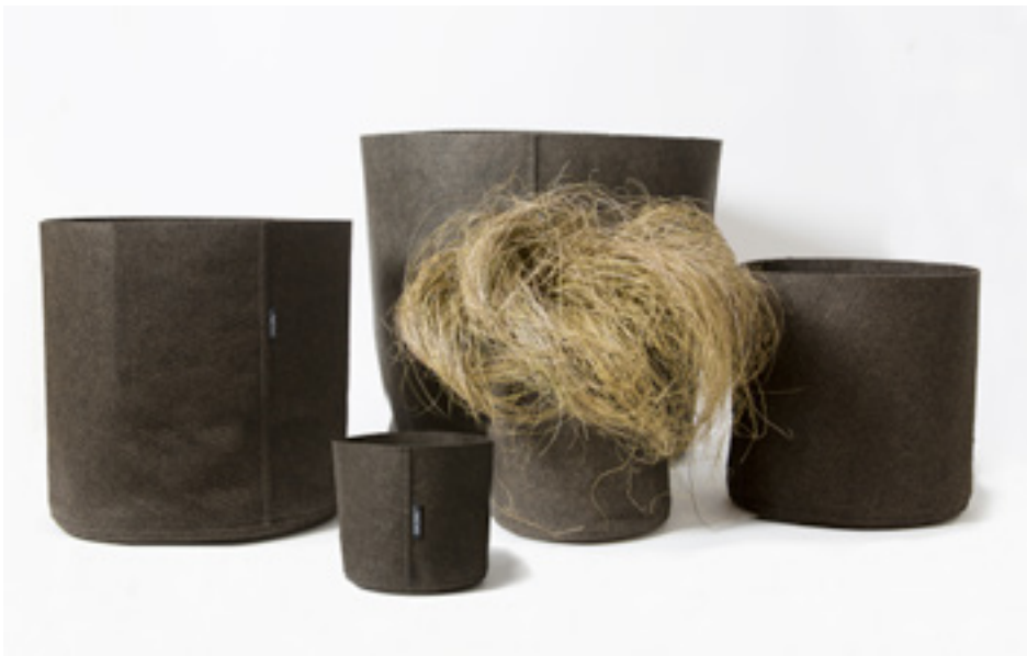
Collection de bacs «Humus»

POT 3L - h: 15 / diam: 15 : 16€ POT 10L - h: 23 / diam: 23 : 22€ POT 25L - h: 32 / diam: 32 : 31€ POT 50L - h: 40 / diam: 40 : 45€ POT 100L - h: 50 / diam: 50 : 59€