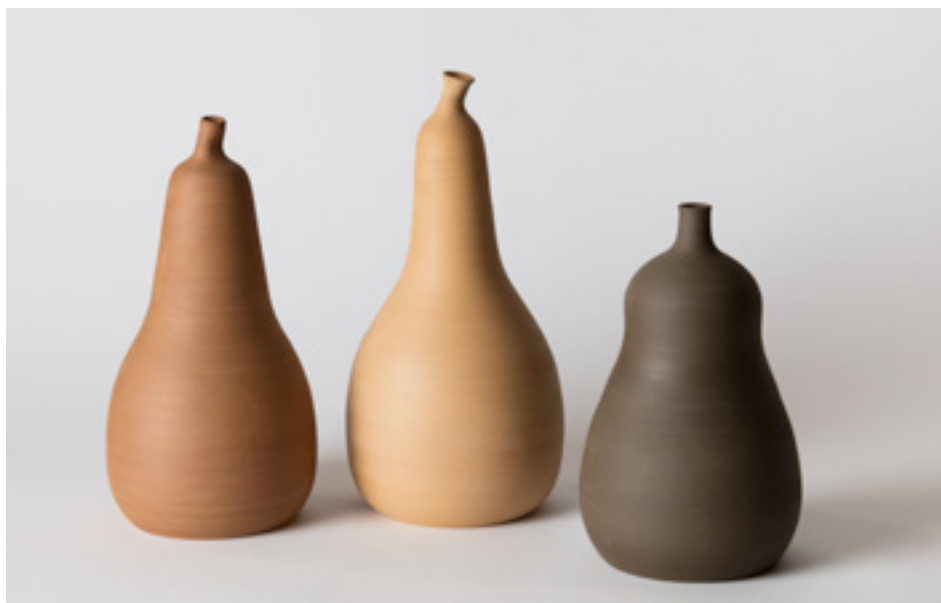
Chantepleure 65 € TTC