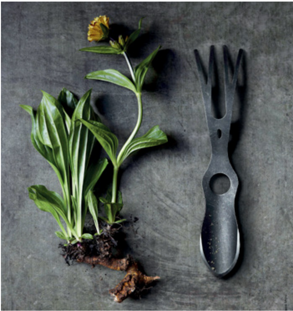
Gardenfetish ©Marie-Pierre Morel 65€ TTC