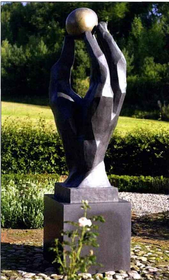
La Main du Createur, 1996.