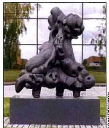
Hommage à Jorn.

Jean-Baptiste Leroux est né en Touraine, dans le « jardin de la France ». Il parcourt l'Europe et le monde pour photographier des paysages, des jardins, des villes et des palais. Sur les murs de la galerie, ses photos ne sont pas seulement belles sur un plan esthétique, elles révèlent quelque chose de mystérieux, voire d'étrange, des lieux visités : la villa Ephrussi de Rothschild, le château de Compiègne,