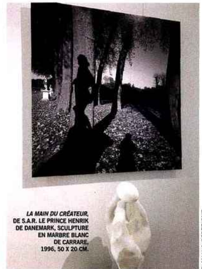
LA MAIN DU CRÉATEUR, DE S.A.R. LE PRINCE HENRIK DE DANEMARK, SCULPTURE EN MARBRE BLANC DE CARRARE, 1996, 50 X 20 CM.

JEAN-BAPTISTE LEROUX, L'OMBRE DE BACCHUS PRÈS DU BASSIN D'APOLLON , TIRAGE UNIQUE DE CHRISTOPHE FERNANDEZ, JET D'ENCRE PIGMENTAIRE CONTRECOLLÉ SUR ALUMINIUM DIBOND, 80 X 80 CM.